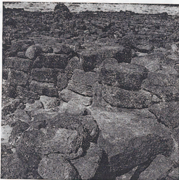
Les blocs taillés de Handoga

A notre connaissance, « Handōga » est le seul endroit du Territoire où l'on trouve des constructions aussi soignées, aussi nombreuses et, de plus, en pierres taillées avec une parfaite maîtrise.