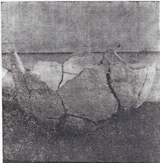
Poterie trouvée à Handoga

Les traces de cendres, charbons et suies sont nombreuses ; il en est de même pour les éclats de poterie dont certains sont décorés avec un motif géométrique. Ceux-là, avec une prédominance pour les maisons situées sur la falaise tournée vers l'oued Shekayti. Peut-être s'agit-il d'anciens ateliers de potiers ? Les tessons de poterie sont très divers, quant à l'épaisseur et à la forme. Certains, visiblement, servaient de récipient d'eau. Un fin dépôt de calcaire s'y retrouve, d'autres semblent plutôt des restes de marmites ( būti en ɛafar ), avec pieds, anses, etc.